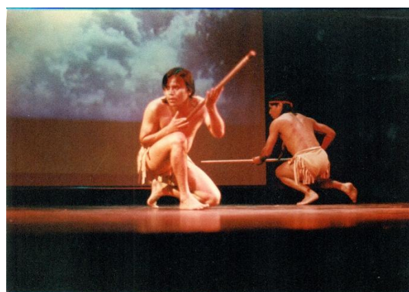
Fig. 1. Up Pá, Tokwaj y otras historias , 1997, registro en video de una función escénica.

pasaban la grasa de pescado para protegerse del frío. Iban a buscar los pescados, y el que era buen cazador volvía a su familia y a sus hijos, y el que no, lo comían los animales, porque existían animales grandes bajo el agua. También cuentan nuestros abuelos que hubo mucha guerra contra ellos, todo lo que cuentan en la televisión o en las revistas o en los libros no son reales, porque morían niños sin piedad, mujeres embarazadas que las destripaban. Y esto es un dolor que les quedó a nuestros abuelos. Ahora los jóvenes no tenemos miedo, sentimos hermanados con los blancos y los criollos. Tenemos la misma libertad como cualquier persona. 25