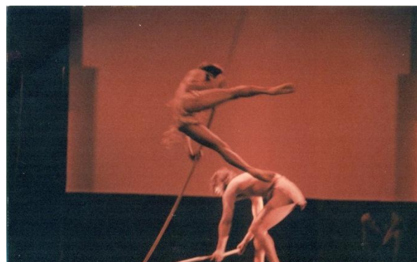
Fig. 2. Up Pá, Tokwaj y otras historias , 1997, registro en video de una función escénica.

en esa obra también hubo mucho trabajo de búsqueda de sonidos y ambientes; también me acercaron grabaciones; fuimos a un estudio y grabamos sonidos onomatopéyicos de distintas cosas y eso fuimos mechando a lo largo de la obra (...) También teníamos la grabación de una hayawú , que sería como un chamán, digamos, cantando y danzando, que lo asociamos con la figura de Tokwaj, que se escucha la voz de la hayawú , una voz muy significativa, muy fuerte, muy ligado a lo ancestral; bueno, que yo intento orquestar para darle un clima, un ambiente. 29