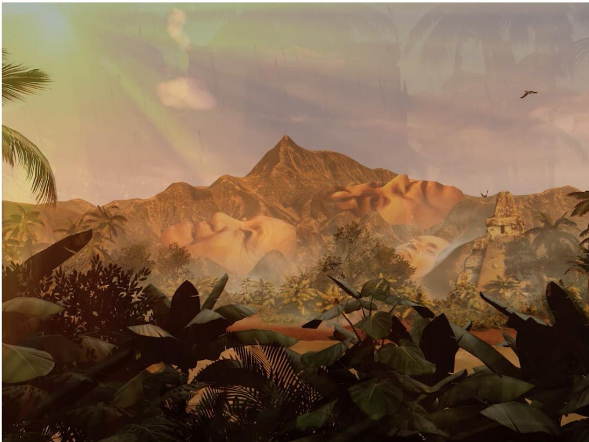
Fig. 3. Alfredo Salazar Caro, Dreams of the Jaguar's Daughter , 2019, Realidad Virtual 360°. https://versiones.midbo.co/22/dreams-of-the-jaguars-daughter/

Este carácter utópico no remite a un ideal futuro, sino a una imaginación situada que emerge desde la experiencia del tránsito. Al descentrar la mirada hegemónica sobre la migración, Salazar-Caro propone una percepción encarnada donde el espectador se ve interpelado no como observador externo, sino como participante dentro del territorio ritual que se despliega a su alrededor. Esta inmersión responde a la estructura fenomenológica de la realidad virtual: el cuerpo del usuario, convertido en interfaz, hace posible una relación afectiva que transforma la comprensión del movimiento migratorio en un acto de presencia compartida. 17 La obra convoca así una forma de heterocronía (tiempos superpuestos) donde el pasado de la comunidad maya, el presente del desplazamiento y la imaginación de un futuro posible coexisten sin jerarquías. Desde la perspectiva latinoamericana, este gesto resulta profundamente significativo: la