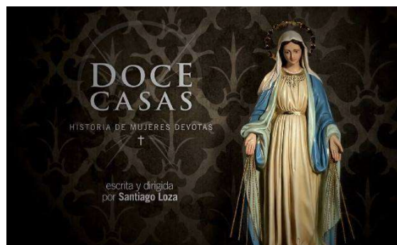
Fig.1. Doce casas. Historias de mujeres devotas (2014, Santiago Loza).

Primero, desde una perspectiva estilística y genérica suele señalarse la calidad estética de los proyectos televisivos que se entroncan con la factura estética cinematográfica y sus convenciones de género. Segundo, a partir de sus estrechos vínculos narrativos, cuya manifestación más evidente es la continuación de las películas por parte de las series, ampliando su universo ficcional ya sea hacia adelante o hacia atrás en función del punto cero del relato, multiplicando las líneas de acción y profundizando en el desarrollo de los personajes; y viceversa, cuando las series devienen películas que condensan lo planteado episódicamente. Tercero, desde el ámbito de la exhibición, a partir de la presencia en los festivales internacionales de cine del formato seriado mediante la creación de secciones especiales para su visualización. Como veremos a continuación, la colaboración entre el cine y la televisión se remonta a los comienzos de su convivencia, cuando la emergencia de la televisión representó, al igual que la aparición de las plataformas de streaming , una amenaza para el futuro del cine y las salas de proyección.