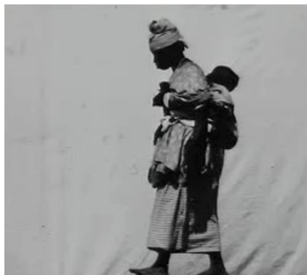
2. Imagen tomada por Felix Regnault, por medio del cronofotógrafo de Marey, y presentada en 1895 durante la Exposición Etnográfica del África Occidental. En ésta se observa una mujer que, sustraída de su entorno, deambula junto a su niño/a por la Station Physiologique de Marey.

Godard en su Godard par Godard que Marey, escuchando sobre la invención de los hermanos Lumière dijo: “Es completamente imbécil. ¿Por qué filmar a la velocidad normal eso que vemos con nuestros ojos? No veo cuál podría ser el interés de una máquina ambulante”. 21 Las dos instancias implicarían, de alguna forma, una relación distinta en la organización y frucción discursiva presentes en las prácticas cronofotográficas.