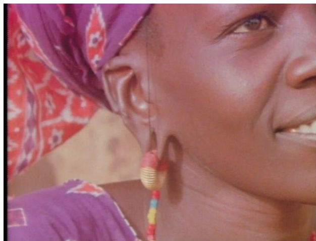
3. Close-up de una de las mujeres que aparecen en Reassemblage (1982) de Trinh T. Minh-ha. En el audiovisual se busca poner en crisis las políticas de representación etnográfica del/a “otro/a” construyendo imágenes que cuestionen la pretensión de objetividad analítica y descriptiva de las ciencias y de sus prótesis y juguetes de registro.