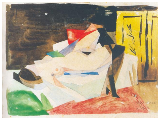
Fig. 7. Julio Vanzo, S/T (Desnudo con biombo), 1919, acuarela sobre papel, medidas y destino desconocido.

En el caso particular de Julio Vanzo, la caricatura y la ilustración fueron modos de insertarse en un campo artístico donde sus experiencias con las estéticas de vanguardia no tenían cabida alguna. En 1919 están fechados unos dibujos acuarelados radicalmente diferentes a los presentados en Witcomb: un autorretrato y una escena de burdel ( Fig. 6 y 7 ) que por la figuración de planos facetados, el uso de las oblicuas en la composición y el cromatismo de alta luminosidad evidencian su conocimiento del “prismaísmo” de Lyonel Feininger. Estas obras tempranas y de fuerte carácter experimental, así como la serie de desnudos eróticos en la que Vanzo cruzó en clave personal elementos del