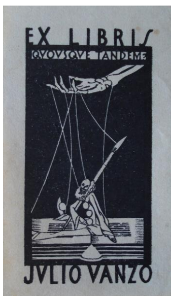
Fig. 13. Julio Vanzo, Ex-libris, c. 1919, linóleo, 7 x 3 cm., colección particular.

También en este caso las imágenes pueden contribuir a sustentar la hipótesis. El ex libris personal dibujado por Julio Vanzo mostraba a una marioneta con traje de Pierrot y una máscara de la comedia con su sonrisa exagerada, sosteniendo un gran pincel y sentado sobre un libro, debajo de la frase quousque tandem? (¿hasta cuándo?), quizás un reclamo ante la imperiosa necesidad de autonomía del artista frente a otros poderes (Fig. 13). Había en este ex libris una fuerte conexión con las ideas que guiaron el proyecto editorial de iCon Permiso! , una revista que mediante el humor buscaba poner coto al accionar inescrupuloso de políticos y de la “humanidad farsante”. 44 Esta voluntad había quedado plasmada en el cabezal