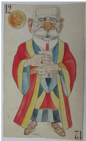
Fig. 5. Julio Vanzo, S/T (caricatura), 1918, tinta y acuarela sobre papel, 53 x 32 cm, colección Castagnino+macro.

la provincia de Santa Fe, empresarios y comerciantes de la burguesía rosarina, y resultó un éxito tanto por las críticas como por las ventas. Las figuras, representadas de cuerpo completo, frontalmente y sobre un fondo neutro, eran retratos sintéticos con algún detalle gracioso, que en ningún caso alcanzaban ribetes ofensivos ( Fig. 5 ). El conjunto de dibujos acuarelados por su línea modulada dejaban entrever la influencia de Eugenio Fornells.