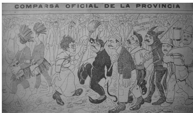
Fig. 2. Pim [Eugenio Fornells], ilustración para iCon Permiso! , 1919, n° 5, pp. 8 y 9.

Los políticos santafesinos fueron los principales protagonistas de las caricaturas de Eugenio Fornells para iCon Permiso! y en varias ocasiones ocuparon la tapa de la revista, conformando sátiras visuales de las noticias de actualidad. En otra ocasión, analizamos en detalle estas imágenes donde “los políticos aparecían travestidos, buscando pactos, comprando y vendiendo voluntades, haraganeando, peleando o compitiendo entre ellos de un modo ridículo, despojados de cualquier dignidad inherente al cargo que ocupaban”. 15 El dibujante preservó en cada escena las características fisonómicas de los retratados para permitir que fuesen fácilmente identificables por el público lector, al tiempo que lograba provocar la risa mediante la visión burlesca de sus actitudes o acciones.