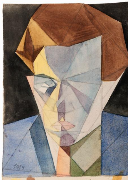
Fig. 6. Julio Vanzo, S/T (Autorretrato cubista), 1919, acuarela sobre papel, 18 x 13 cm, colección Castagnino+macro.

La práctica del retrato como modo de captar la atención de nuevos compradores entre la burguesía no era nueva. La trayectoria de Emilia Bertolé constituye un caso paradigmático en este sentido. Sus retratos por encargo la convirtieron en una figura destacada tanto en la escena artística local como en Buenos Aires. 29 Cabe señalar también el accionar de pintores provenientes de otras ciudades que al organizar sus exposiciones en Rosario, sumaban a la oferta obras especialmente realizadas para la ocasión. Tal sería el caso del pintor español Ricardo López Cabrera, residente en Córdoba, quien se presentó en el Salón Castellani paralelamente a la muestra de José Andrade. Traía consigo retratos y paisajes de las sierras, a los que decidió agregar durante el transcurso de la muestra una serie de retratos de “conocidas personas de Rosario”. 30