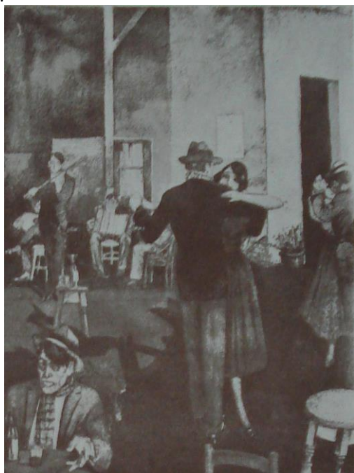
Fig. 11. Jacobo Abramoff, En el cabaret , c. 1920, s/d, destino desconocido, imagen reproducida en La Revista de El Círculo , 1920.

Esta “formación de especialización” 38 permitió exponer públicamente a un conjunto de artistas que no participaban de los salones oficiales. La falta de apoyo que sentían estos primeros creadores instalados en la ciudad se reflejó en comentarios como el recién citado y en el propio catálogo. La gran mayoría de sus socios activos eran inmigrantes que se habían instalado en Rosario abriendo las primeras academias de arte