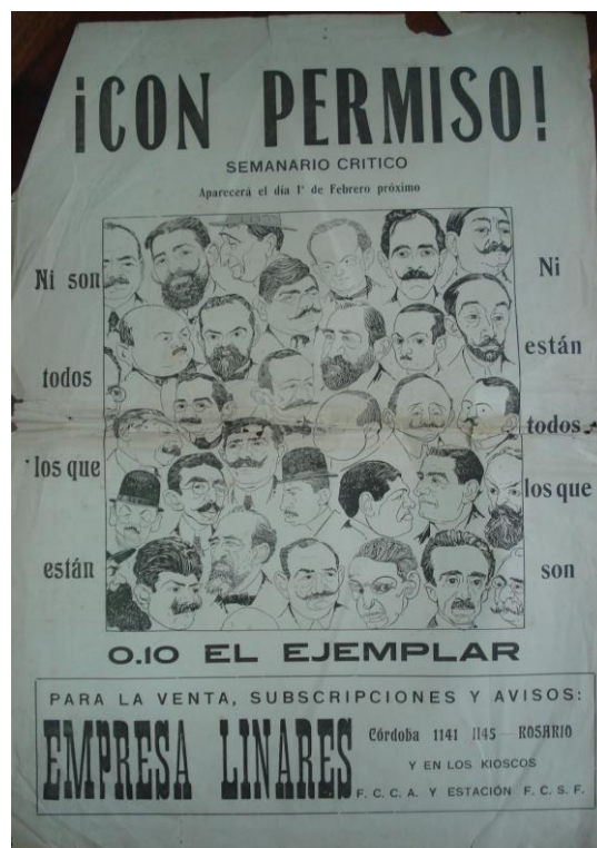
Fig. 1. Afiche publicitario de ¡Con Permiso!, enero de 1919, impresión sobre papel satinado, 42 x 30 cm., colección particular.

generales de historia del arte o en críticas periodísticas como una elección excluyente dentro del ámbito de la creación visual, necesaria para quienes carecían de otros recursos económicos. Las referencias a este tipo de materiales gráficos por lo general no versaron sobre sus características estéticas intrínsecas, sino que solo fueron señalados entre las diversas formas de obtención del sustento. Para José León Pagano, la práctica de la ilustración constituyó una opción rentable que alejaba a sus autores del mundo del arte, una instancia que necesariamente debían trascender para finalmente dedicarse a la pintura. 3 Estas actividades fueron llevadas adelante casi siempre por creadores extranjeros, precursores de un arte nacional, en busca de reconocimiento y valoración dentro del campo de las Bellas Artes y no sólo en relación con las artes aplicadas. En este sentido cabe destacar la actuación de La Colmena Artística en Buenos Aires a partir de 1895, sus intentos por generar espacios alternativos a los salones del Ateneo y el lugar que le otorgaron al humor en sus planteos estéticos y críticos. 4