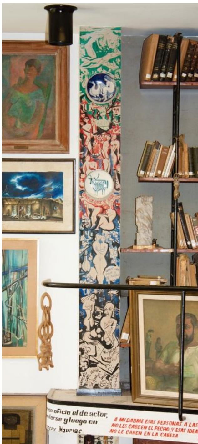
Fig. 3 Rodrigo Bonome, sin título, 1958, pintura al agua sobre pared, piezas cerámicas colgadas, 240 x 28 cm, EFDA