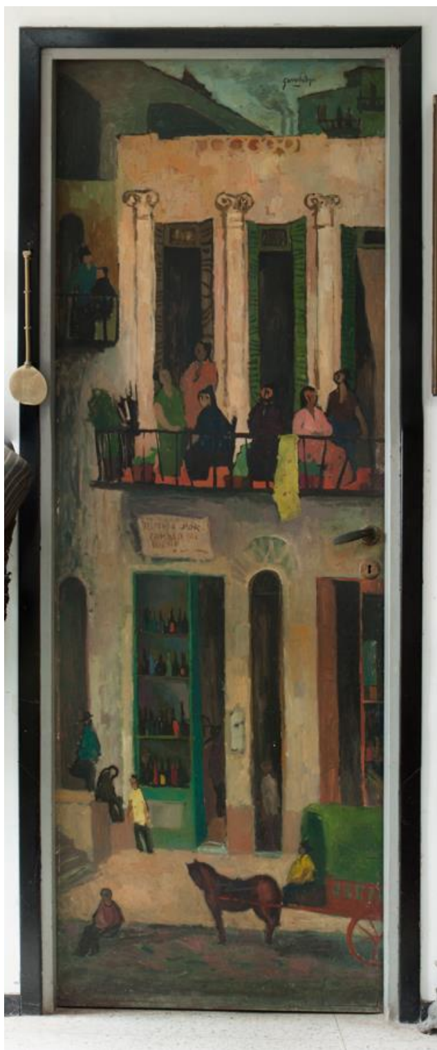
Fig. 7 Claudio Gorrochategui, sin título, sin fecha, óleo sobre madera, 210 x 72 cm, EFDA.

Sin embargo, el hecho de encontrar una obra inscripta sobre alguno de los soportes no tradicionales, no siempre permite reconstruir la situación, el ánimo y la proximidad amistosa del