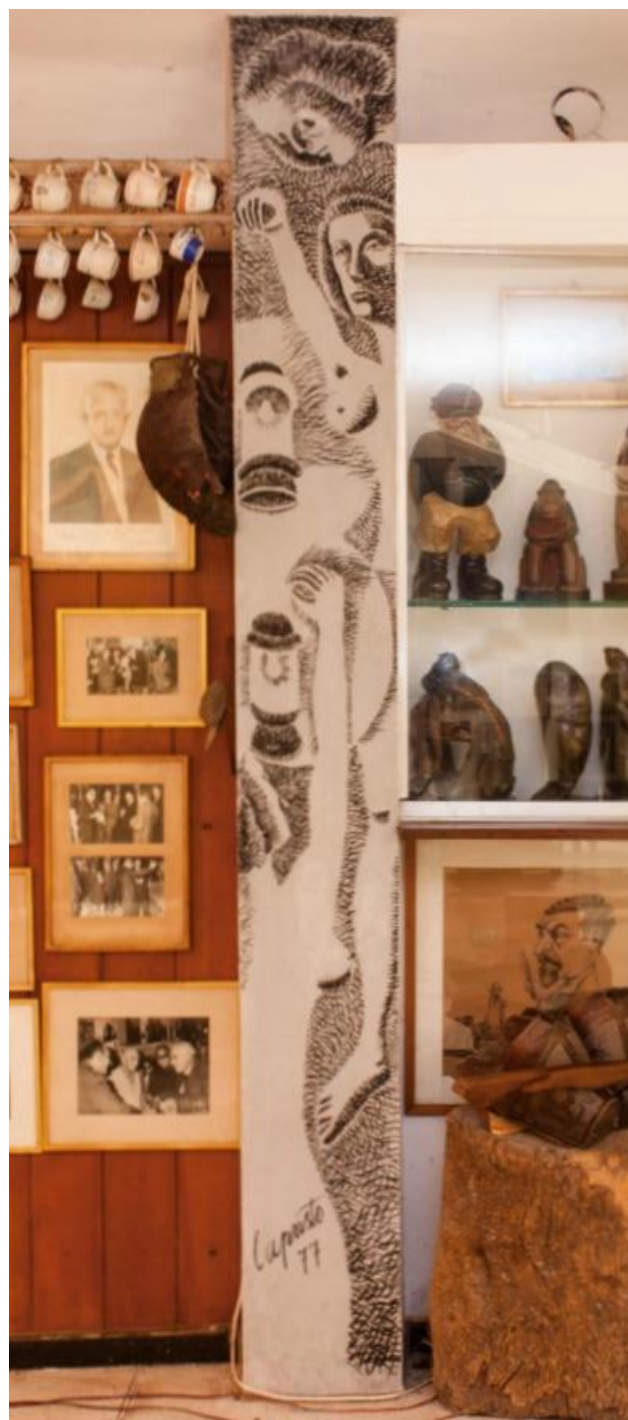
Fig. 10 Oscar Capristo, Mujer con lámpara , 1977, pintura sintética sobre pared, 240 x 28 cm, EFDA.

Cuando partimos de la obra-puerta “originaria” de Brusau, señalamos que en el paso de un Fogón a otro fue des-funcionalizada al ser retirada de un espacio que la aparatizaba como obra-puerta para pasar ser re-funcionalizada y re-aparatizada en y por otro espacio que la auratiza y exhibe como obra-pintura. Describimos entonces este movimiento como una bisagra porque nos interpela en lo que en ella había de puerta. Ahora llevaremos nuestra atención a los cambios en los modos de agenciamiento en un mismo espacio arquitectónico, el término mudanza , recuperado