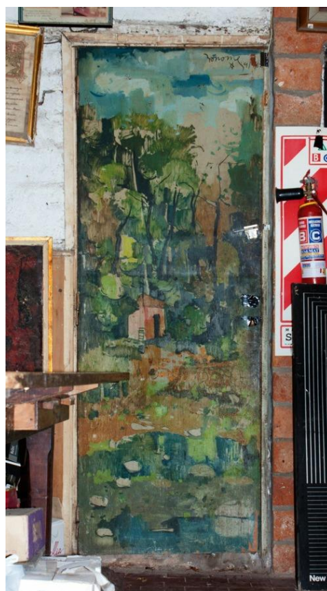
Fig. 13 Rodrigo Bonome, sin título, sin fecha, óleo sobre madera, 196 x 70 cm, EFDA.

una ventana que se encuentra a su lado. La encontramos en el “Galpón de los crotos”, un espacio que actualmente funciona como depósito de numerosos objetos, obras, documentos, utensilios de cocina, heladeras del bar, etc., por lo cual no conforma parte del circuito “público” de visitas. Si bien no podemos precisar su fecha de producción, la misma fue realizada en la década del sesenta y se corresponde con otras experiencias del mismo artista en el Fogón y en espacios privados de Resistencia. El espacio donde se encuentra esta puerta está próximo a ser remodelado y refuncionalizado como un nuevo ámbito expositivo, además de edificarse sobre su planta un nuevo depósito para archivar y conservar adecuadamente documentos, publicaciones y obras no exhibidas. Ambas modificaciones del espacio arquitectónico son producto de la agencia administrativa de la Fundación El Fogón de los Arrieros. 62