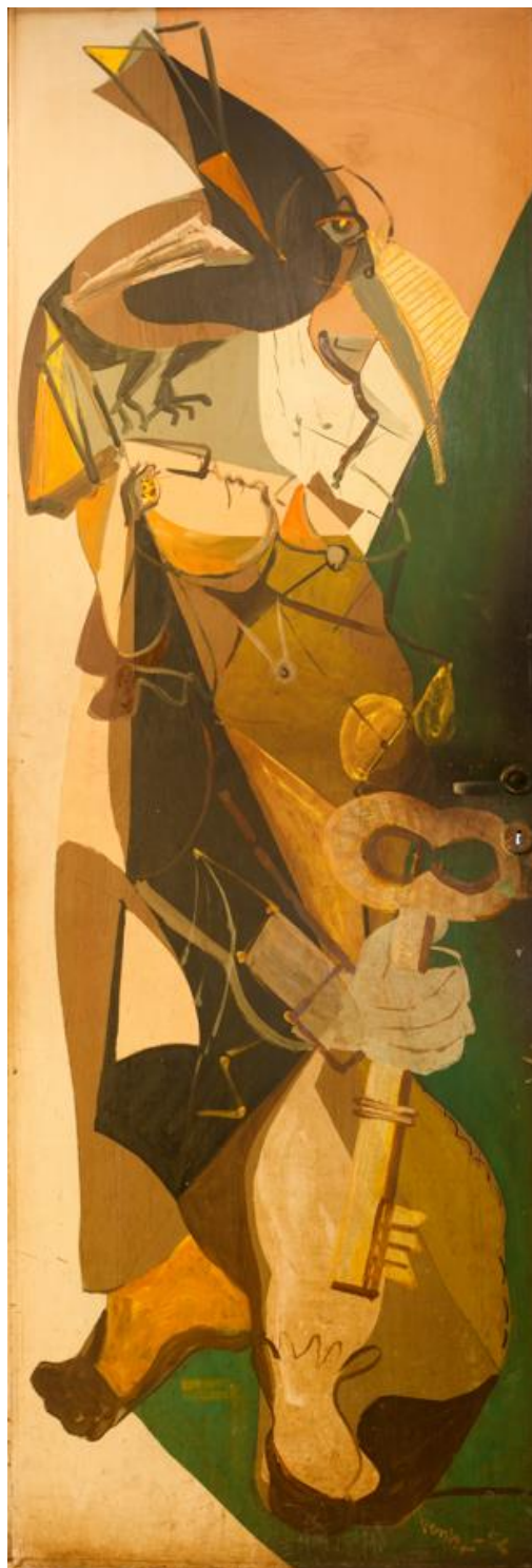
Fig. 11 Bruno Venier, sin título, 1956, pintura al agua sobre madera, 210 x 72 cm, EFDA.

Según puede desprenderse de este fragmento, el valor “imponderable” de esta obra no se encuentra en sus “propiedades banales”, sino en la significación de lo que “simboliza”: la Orden de la llave. Ligado a su valor y su significado, se menciona la funcionalidad como “puerta que