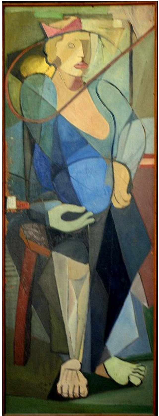
Fig. 2 René Brusau, Mujer , sin fecha, óleo sobre madera, 178 x 68 cm, EFDA.

Así, en el antiguo edificio de EFA –una casachorizo donde la aventura fogonera se extendió entre 1943 y 1955– Brusau pintó en una puerta una figura de mujer en el lenguaje postcubista que caracterizaba su producción. De los registros documentales con que actualmente contamos, esta pintura fue el primer antecedente de agenciamiento de elementos funcionales del espacio por parte de un artista. Sin embargo, lo que nos parece significativo es el hecho de que al trasladarse la casa de Boglietti – El Fogón , como ya era social y culturalmente conocido– al edificio moderno que hoy lo caracteriza, la puerta-pintura de Brusau fue desmontada, enmarcada y posteriormente expuesta junto a otras obras en una de las paredes de su sala principal.