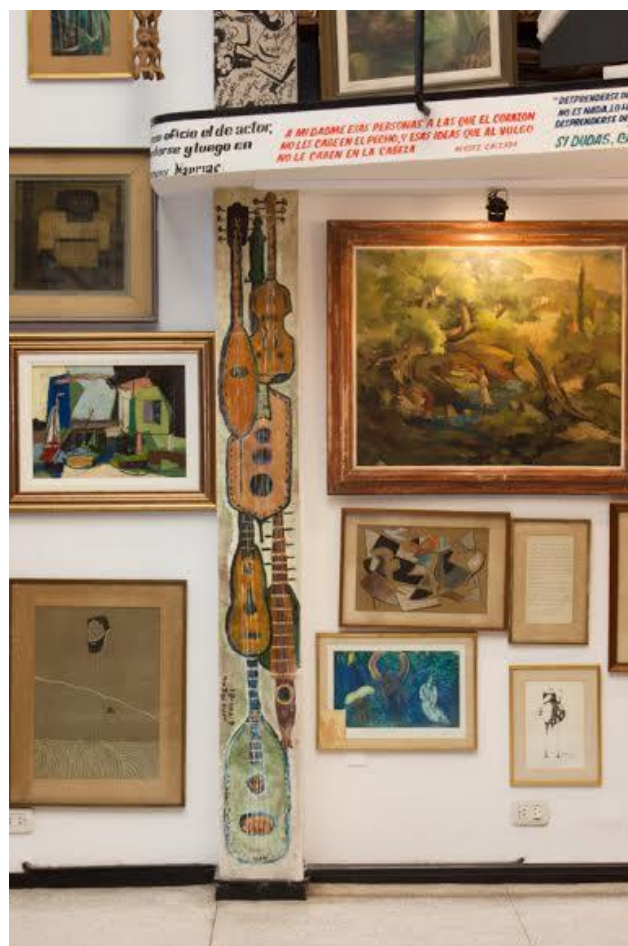
Fig. 8 Juan Otero, sin título, 4 de agosto de 1961, óleo sobre pared, 240 x 28 cm, EFDA.

grupo fogonero con el artista que la produjo. En el caso de Juan Otero, que pinta una columna en el siguiente mes de agosto, pudimos advertir que no se hace mención alguna ni de su visita, ni de la situación en la que pintó la columna en el BFDA. (Fig. 8) Recién encontramos su nombre en el Boletín de octubre de ese año, en un apartado donde se comenta que 6 caballeras y 16 caballeros invaden la orden de la llave, 53 cuando junto a Gorrochategui (n° 285) y Vázquez (n° 286), es nombrado llave n° 291, precedidos todos por la rúbrica “pintor”. 54 Tampoco ha sido posible documentar su visita en la colección de catálogos de exposiciones ni en la correspondencia, lo cual nos lleva a preguntarnos si Otero era un artista-paracaidista.