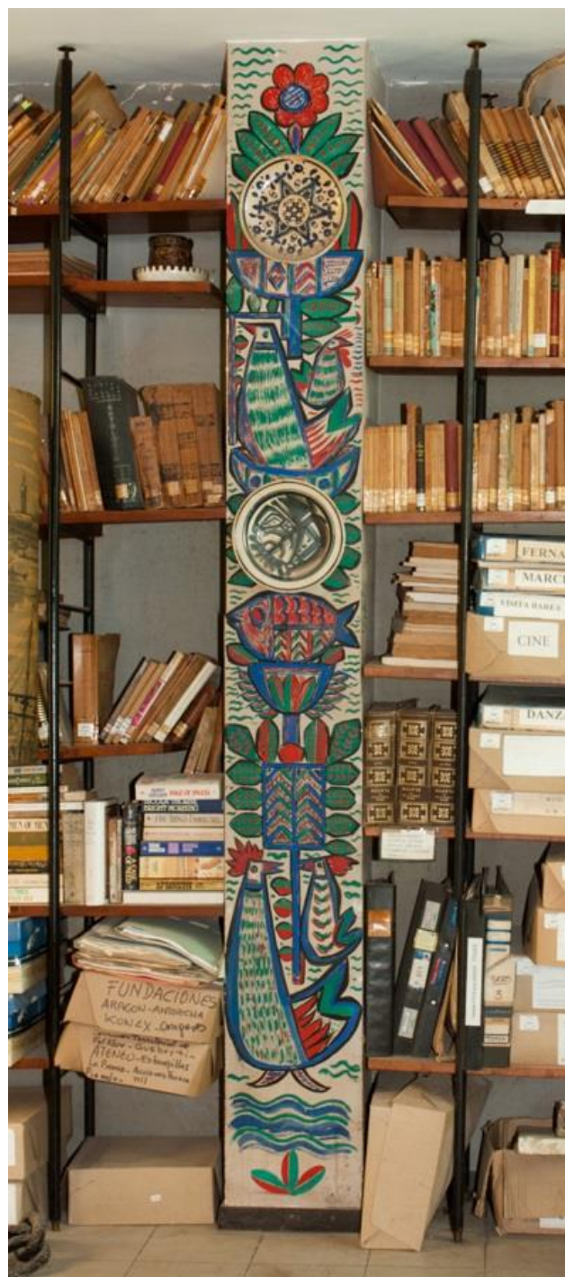
Fig. 4 Fernando Arranz, sin título, 1958, pintura al agua sobre pared, piezas cerámicas colgadas, 240 x 28 cm, EFDA.