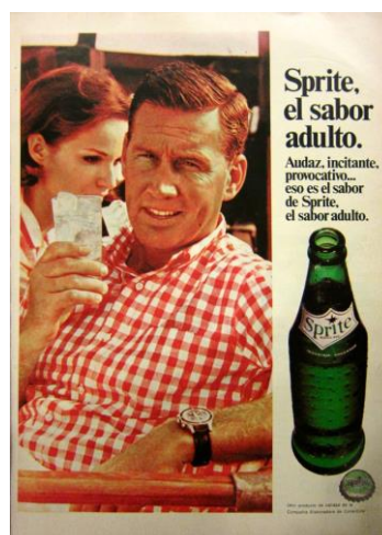
Fig.1 Adán , febrero de 1968, año 2, núm. 19

Desde los años del primer peronismo, el ambiente intelectual que rodeaba a Abril se había caracterizado por ser culto y refinado. 14 Los editores y realizadores de Adán encontraron en la empresa de Civita un espacio propicio para introducir ciertos rasgos rupturistas que caracterizaban al nuevo periodismo 15 , y que aquí resumimos con el concepto de modernización irreverente por su estilo provocador y directo, contestatario y desinhibido, y sus aspiraciones y