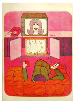
Fig.5 Adán , septiembre de 1966, año 1, núm. 3

Al revés que en los ensayos fotográficos y las publicidades, donde las fotografías, con sus cualidades de verdad y de realidad, decían menos que el texto (que, como se ha visto en el supuesto testimonio de Adriana Buteler, desnudaba los cuerpos y desataba la vida de las personas de sus anclajes convencionales), en los dibujos de las páginas de humor, la imagen decía más que la palabra (si es que la había). (Fig.5)