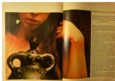
Fig.7 Adán , agosto de 1966, año 1, núm. 2

Como se ha visto, Adán manipuló ingeniosamente la combinación de los recursos artísticos y técnicos a su alcance para mostrar ese mentado “erotismo real”. Otro ejemplo de esto mismo es la imagen que acompañaba una nota sobre viajes a la pintoresca ciudad de Pomaire en Chile, célebre por su arte en cerámica. En ella se aprecia muy bien cómo se esquivan las poses convencionales de la fotografía erótica y de la pornografía. El arte termina de componer la imagen del cuerpo, y es el conjunto que deja “ver” o imaginar las partes del cuerpo femenino que la fotografía excluye. (Fig.7)