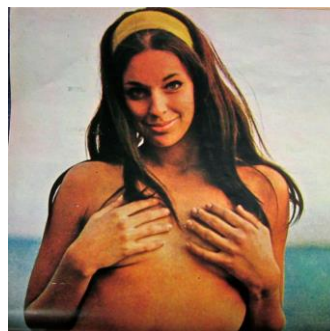
Fig.4 Adán , febrero de 1968, año 2, núm. 19

El erotismo era, en efecto, fantasmagórico. Estaba donde no se lo veía. Se dejaba ver en lo que no se mostraba (Fig.3) En verdad no se “pispeaba la más mínima teta”. No había nada de “truculento” en Adán , nada de “pornográfico”. (Fig.4) Esto ocurría tanto en los dibujos como en las fotografías (fueran estas imágenes publicitarias, ensayos fotográficos o fotos de tapa). Las imágenes cómicas, en cambio, parecen haber tenido cierta ventaja. Si en algunas de ellas sí fue posible pispear tetas fue porque, como es sabido, el humor es un instrumento eficaz para decir lo indecible. En Adán , en un ambiente de censura y de autocensura, muchas veces las imágenes cómicas expresaron visualmente aquello que estaba vedado a la palabra.