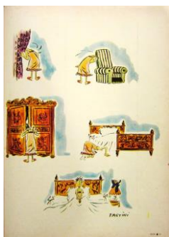
Fig.3 Pastini, Adán , agosto de 1966, año 1, núm. 2

Si es cierto que el erotismo de Adán evitaba el convencionalismo de la modelo “fantasma de sí misma” tal como postulaba en el ensayo fotográfico citado más arriba, también es cierto que era un “erotismo fantasmagórico al revés”. Es decir, el contenido erótico no estaba dictado desde el propio equipo editorial de Adán , sino desde fuera, desde el poder censor del Estado. De hecho, muy probablemente por las presiones del contexto, González O’Donnell y Martelli habían tenido que irse de Adán . 25