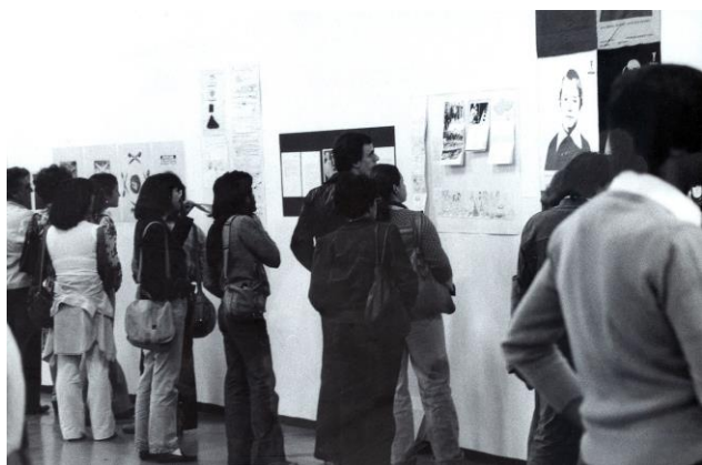
Fig. 4 Poéticas Visuais , 1977.

amenazaba conferir un aura a estas obras reproducidas; por lo tanto, los espectadores podrían reproducirlas de nuevo, difundiéndolas aún más, fuera de los confines de la institución. En otras palabras, las obras nuevamente modulaban la lógica de exposición, convirtiéndola en un conducto de sus maniobras anti-elitistas.