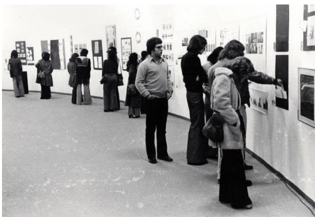
Fig.1 Prospectiva 74 , 1974.

inculcaba una sensación de inmediatez y, en última instancia, hacía hincapié en la divergencia radical articulada por la exposición: éstas no eran obras preciosas y singulares protegidas en cajas, sino envíos íntimos, hechos desde cerca y desde lejos, dentro de sobres baratos. Eran invitaciones a intercambiar y a colaborar, conexiones rizomáticas disfrazadas bajo la apariencia mundana y burocrática del correo postal, que esquivaban la censura impuesta por el régimen brasileño.