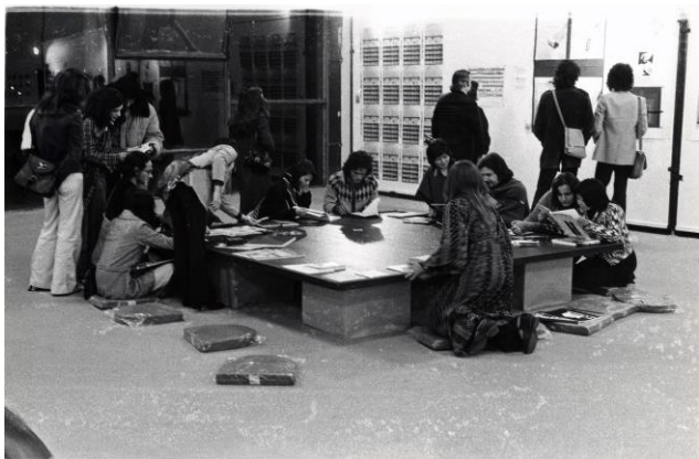
Fig.2 Prospectiva 74 , 1974. Arquivo Museu de Arte Contemporânea da Universidade de São Paulo.

Durante los siguientes tres años, Zanini y Plaza continuaron escribiéndose con los artistas participantes de Prospectiva 74 y expandiendo su red, ya fuese a través del correo o a través de iniciativas como dos exposiciones realizadas en 1976, Multi-Media II –que contó con la obra de artistas paulistas inmersos en la impresión experimental junto a obras de Peter Vogel y Klaus Groh– y Década de 70 , una exposición colectiva organizada por el