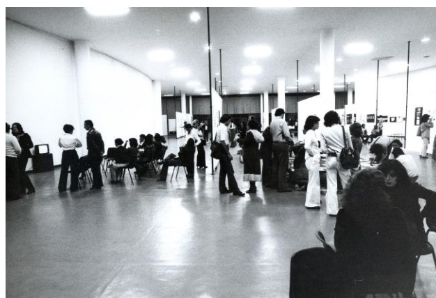
Fig.5 Poéticas Visuais , 1977.

declaraba con entusiasmo, “sobre todo en la última década, un tipo de fenómeno samizdat 20 que se desarrolla paralelamente y alternativamente a los sistemas tradicionales de arte, ha surgido como un movimiento anartístico ”. 21 Anartístico : neologismo de Plaza que combina “anarquista” y “artístico”, encapsulaba de manera convincente el espíritu vanguardista de las obras expuestas en Prospectiva 74 y Poéticas Visuais , así como su reflexivo caos visual y material. Esta ausencia de orden venía junto a la forma en que estas obras forzaron a la práctica expositiva a colapsar las fronteras disciplinarias, a disipar las distinciones entre artistas emergentes y establecidos e ignorar las demarcaciones geopolíticas de “centros” y “periferias”. Las obras también nos plantean un reto metodológico más: pues nos animan, en última instancia, a re-concebir la exposición no como la finalidad de una obra, sino como un componente de su desdoblamiento.