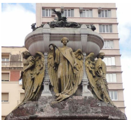
Fig. 9 Ettore Ximenes, Mausoléu Manuel Belgrano , detalhe Anjos, 1903, Igreja de São Domingos, Buenos Aires, fotografia de Michelli Monteiro.

No Mausoléu Belgrano, onde, ausentando a figura do herói, o artista tomou parte de quatro sentinelas angelicais ao lado de uma urna, o projeto arquitetônico do estatutário, o qual colocou abaixo as duas figuras Pensiero e Azione , projeto absolutamente escultórico. Ignoramos se qualquer minúcia tenha sido dada a um arquiteto, pois estamos seguros que a ideia do mausoléu é de cima a baixo ideia de Ximenes. 61