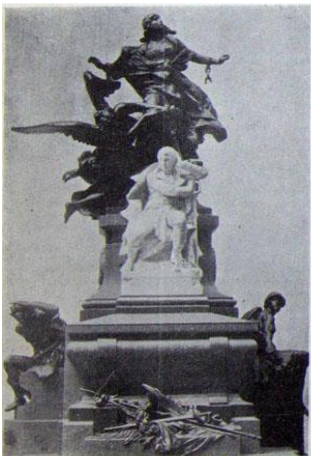
Fig. 5 Jules-Félix Coutan, Projeto Mausoléu a Manuel Belgrano , Reprodução na revista La Ilustración Sud-Americana , a. VI, n. 136, 16 Agosto de 1898, p. 316.

escultores franceses , o que demonstra a atenção que a imprensa especializada italiana prestava a essa nova disputa, que colocava em risco a vitória italiana. 45