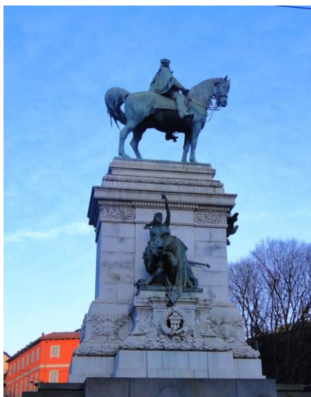
Fig. 2 Ettore Ximenes, Monumento a Giuseppe Garibaldi , 1895, Milão, fotografia de Michelli Monteiro.

concurso para um monumento em homenagem ao episódio da unificação italiana Sbarco dei mille , em Marsala, na Sicília, em 1893. A sua maior conquista até a viagem à Argentina foi o Monumento a Garibaldi (Fig. 2) erguido em Milão, resultante de um concurso que se desenrolou desde 1884, tendo Ximenes alcançado a vitória em 1887. O monumento de Milão foi inaugurado em 1895, tendo sido amplamente divulgada nas revistas italianas, que tinham grande circulação internacional, inclusive nos países de emigração peninsular como a Argentina.