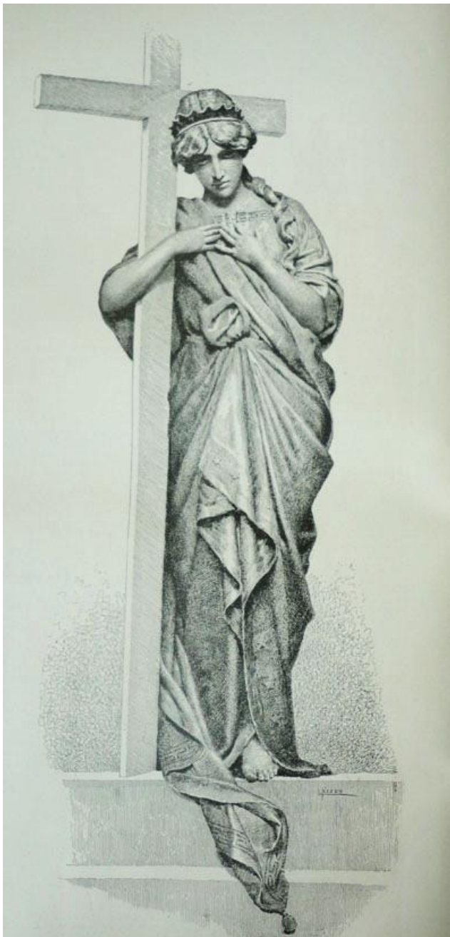
Fig. 4 Ettore Ximenes, Fé , Capela conde, Petrangolini, 1886, Cemitério Monumental de Urbino, reprodução na revista Illustrazione Italiana , a. XIII, n. 45, 31 Ottobre 1886, p. 326

representa uma alegoria feminina segurando uma cruz (Fig. 4), estátua essa que foi reproduzida com grande destaque na revista L'Illustrazione Italiana , em 1886.