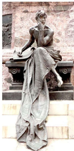
Fig. 10 Ettore Ximenes, Mausoléu Manuel Belgrano , detalhe Pensador, 1903, Igreja de São Domingos, Buenos Aires, fotografia de Michelli Monteiro.

da identidade argentina, ao mesmo tempo em que iniciou a internacionalização efetiva de uma carreira artística no exterior que o notabilizaria no cenário italiano, cujo poder dependia, como na França, de uma ampla recepção estrangeira para manter sua centralidade no circuito artístico ocidental.