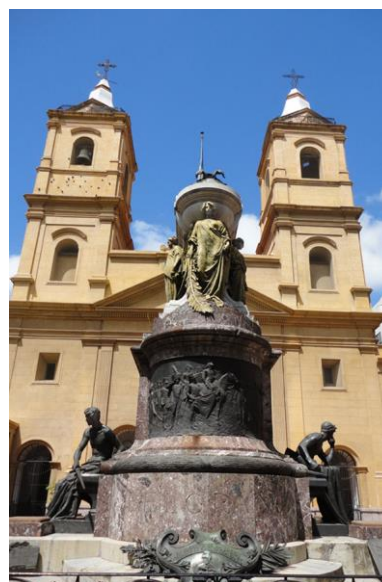
Fig. 1 Ettore Ximenes, Mausoléu a Manuel Belgrano , 1903, Igreja de São Domingos, Buenos Aires, fotografia de Michelli Monteiro.

O objetivo principal desse artigo é refletir sobre a intensificação das relações artísticas entre Argentina e Itália, na passagem do século XIX para o XX, tomando-se como foco a vitória de Ettore Ximenes no concurso para o Mausoléu ao General Belgrano. Propõe-se documentar e analisar os debates que envolveram a escolha de Ximenes para a construção desse monumento, a fim de perceber-se as tensões em torno da escolha de um artista estrangeiro e italiano para a representação do passado argentino em face de seus concorrentes nacionais e franceses. Pretende-se também aferir a importância do concurso portenho na trajetória profissional de Ettore Ximenes, verificando-se o impacto dessa conquista na carreira de um jovem artista peninsular que, como muitos outros de sua geração, lançava-se ao exterior como forma de projetar-se em seu próprio país de origem.