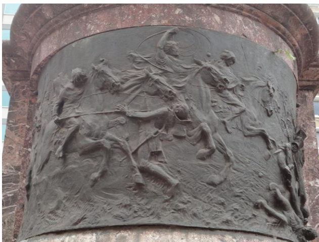
Fig. 11 Ettore Ximenes, Mausoléu Manuel Belgrano , detalhe Batalha de Tucumán, 1903, Igreja de São Domingos, Buenos Aires.

Como foi possível constatar, o trânsito de artistas italianos para a América não era uma via de mão única, que servia apenas aos interesses de líderes locais. Se para as elites argentinas era necessário ter a chancela internacional nos monumentos que estavam sendo erigidos, os escultores italianos aproveitavam o próspero mercado de monumentos portenhos, públicos ou privados (como os túmulos particulares) para projetar suas carreiras internacionais. Foi essa a intenção de Ettore Ximenes ao abrir um estúdio artístico em Buenos Aires e realizar uma exposição de suas obras, esforço que teve resultados positivos, já que ele recebeu encomendas, como o Mausoléu a Muñiz e o busto da República Argentina, além da consagração da encomenda dedicada a Belgrano.