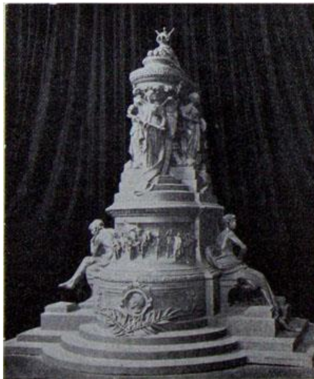
Fig. 6 Ettore Ximenes, Projeto Mausoléu a Manuel Belgrano , Reprodução na revista La Ilustración Sud-Americana , año VI, n°136, 16 Agosto de 1898, p. 316.

ainda distante da fama da consagração nacional e internacional que estabeleceria nas duas primeiras décadas do século XX. 48