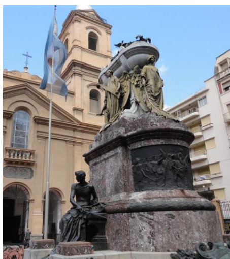
Fig. 8 Ettore Ximenes, Mausoléu Manuel Belgrano , 1903, Igreja de São Domingos, Buenos Aires, fotografia de Michelli Monteiro.

Os periódicos portenhos publicaram diversas notícias sobre o andamento das obras do