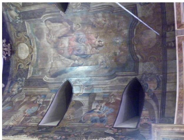
Fig. 13 José Joaquim da Rocha e escola, Nossa Senhora do Rosário , pintura de quadratura e alegorias dos quatro continentes, post 1781, igreja de Nossa Senhora do Rosário das portas do Carmo, capela-mor, Salvador.

Em Salvador da Bahia, a proliferação das pinturas de quadratura na segunda metade do século XVIII testemunha a progressiva complexificação social dos agentes transmissores da mensagem da fé católica. Um caso emblemático é representado pelos tetos da nave e da capela-mor da igreja de Nossa Senhora do Rosário das Portas do Carmo da Irmandade dos Homens pretos em Salvador onde, nos anos Oitenta do século XVIII, as alegorias dos quatro continentes voltaram a ser utilizadas ( Fig. 13 ).