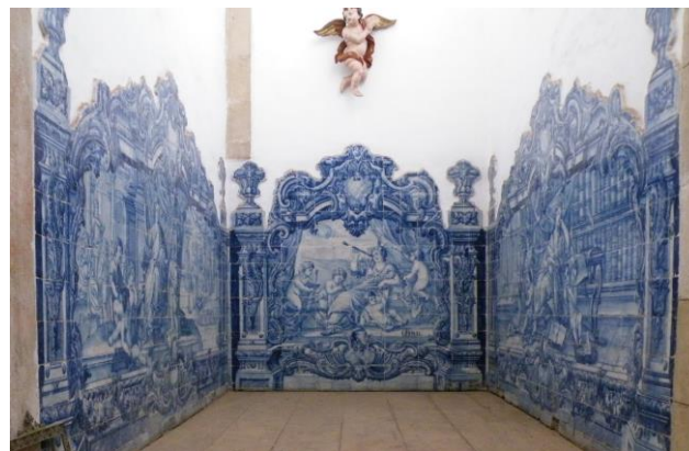
Fig. 7 Produção joanina, Ótica , azulejos, Salvador, ex-colégio jesuíta, vão da escadaria da antiga sala da biblioteca, antes de 1742.

Como já foi referido, a Sé e a igreja da Companhia de Jesus foram reconstruídas e decoradas nos finais do século XVII. Quando Ribeiro chegou, na Bahia os interiores dessas igrejas já estavam concluídos, mas os Jesuítas não renunciaram à novidade trazida pelo pintor lusitano incumbindo-o da decoração da sala da biblioteca do colégio. A escolha de não utilizar os artífices-irmãos da Companhia, como era costume, e mandar pintar o teto por ele confirma o interesse despertado. Esta peculiaridade determinou também a falta de registros documentais relativos a esta obra. A exceção de Carlos Ott e desde os escritos de Robert Smith, a crítica concordou na atribuição ao António Simões Ribeiro baseada na análise estilística. A proposta da sua datação por parte dos historiadores oscila entre 1735 e 1740.