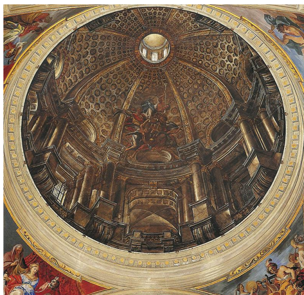
Fig. 6 Andrea Pozzo, Zimbório pintado , 1685, óleo sobre tela, igreja de Santo Inácio, Roma.

A referência à importante obra em caixotões do teto de Nossa Senhora de Loreto, a igreja da nação italiana em Lisboa, resulta como segunda opção perante o desequilíbrio entre capela-mor e nave da Sé. O chantre estava a observar os mandamentos tridentinos codificados por Carlo Borromeo em Instructionum fabricae et suppellectilis ecclesiae (1577), onde se destacava a importância ritual, simbólica e decorativa da capela-mor em relação ao corpo da igreja.