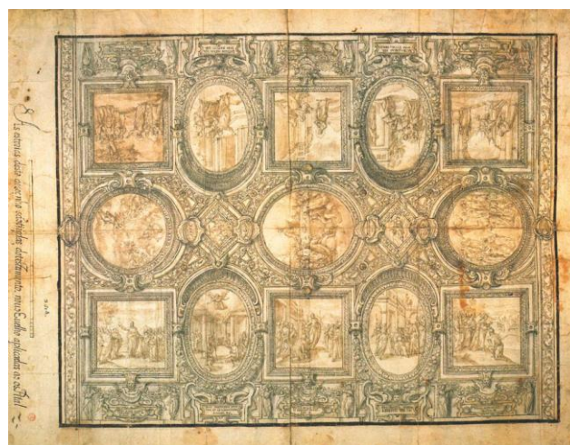
Fig. 2 Fernão Gomes, Projecto para a pintura do tecto da nave da Igreja do Hospital de Todos os Santos, 1580-1590, desenho, 523 x 665 mm, Biblioteca Nacional de Portugal, Secção Iconografia inv. D6R, Lisboa.