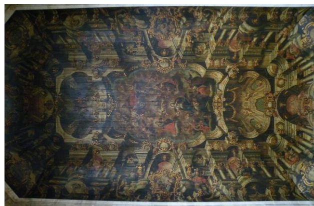
Fig. 12 José Joaquim da Rocha, Cordeiro místico, Nossa Senhora da Imaculada Conceição, alegorias dos quatro continentes e pintura de quadratura , 1774, igreja de Nossa Senhora da Conceição da Praia, nave, Salvador.

linguagem introduzida por Vincenzo Bacherelli em Lisboa e por António Simões Ribeiro em Salvador. Toda a pujança tridimensional da construção da quadratura visa edificar as verdades da fé católica até se abrir ao triunfo celeste do Santíssimo Sacramento e da Imaculada Conceição. A figura da Virgem domina o centro da representação pictórica. 83 No mundo celeste, representado pela abertura ao céu do sfondato , a Virgem intermedeia o plano divino com a totalidade do mundo terreno: Europa, América, Ásia e África .