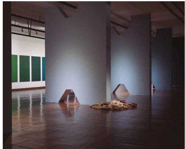
Figura 1. Vista de la planta baja del MNAV con los pilares de Clorindo Testa nuevamente a la vista, la obra Mono en el suelo y detrás un fragmento de la obra Croma IX .

político) del Museo Nacional de Artes Visuales (MNAV) del Uruguay, en principio temporaria, pero con una capacidad reflexiva y transformadora que sospecho trascendente: Aquí soñó Blanes Viale (ASBV). 3