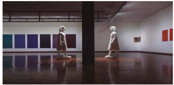
Figura 6. Pablo Uribe, Hostesses , 2018, calcos en yeso, 165 x 42 x 59 cm.

5.- Discute también los conceptos de original y copia en la escultura, invirtiendo el proceso del original modelado en yeso y su posterior fundición en bronce. Sus seis Hostesses son calcos en yeso de un original en bronce de Bernabé Michelena. 10 Esa joven está allí en bronce y luego su fantasma blanco aparece aquí y allá, señalando diferentes aspectos de la exposición, como una guía amable que invita al visitante a detenerse y mirar con ella. (Fig. 6)