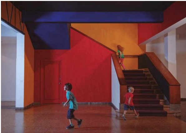
Figura 8. Pablo Uribe, Pax in lucem , 2018, óleo sobre pared en caja de escaleras, dimensiones variables.

10.- La muestra de Uribe habla también de la seguridad en los museos, de su responsabilidad en el cuidado del patrimonio, de un modo sutil y a la vez muy conmovedor. Exhibe en la pared de referencias un fragmento y un boceto del mural Pax in Lucem de Joaquín Torres García, una de las casi cien obras del artista y su taller incendiados en el Museo de Arte Moderno de Rio de Janeiro en 1978. Y produce un ambiente visual y olfativo que remite a aquella obra y al taller de Torres en un tramo de escalera que se vuelve así una instalación constructivista en recuerdo de aquellos murales perdidos. El reciente incendio devastador en el Museo Nacional de Rio volvió a poner sobre el tapete las consecuencias tremendas del descuido de museos antiguos y la pérdida irreparable de miles piezas y fragmentos de historia y memoria. (Fig. 8)